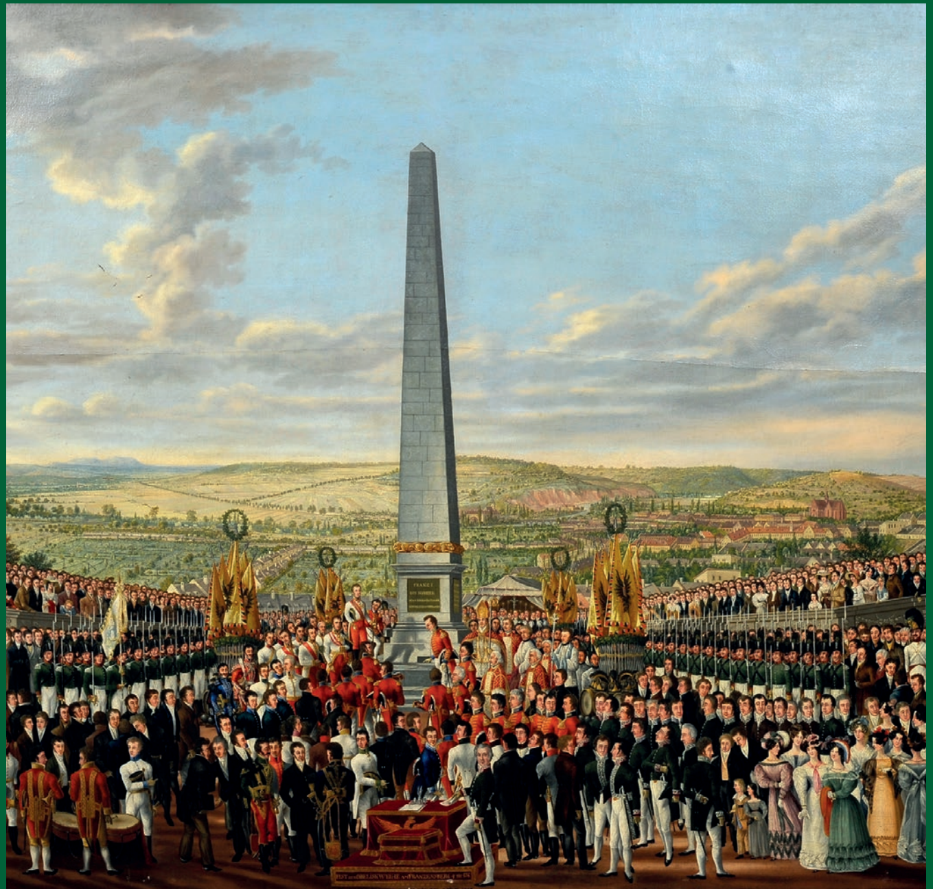
František (Franz) Richter – Die Segnung und die Legung des Grundsteines für das Denkmal zur Erinnerung auf die Beendigung der napoleonischen Kriegeunter Teilnahme des Erzherzogs Ferdinand am Sonntag 4. 10. 1818.

Dieses Friedensdenkmal in Brünn wurde von den mährischen Ständen seit dem Jahre 1849 als eine der Mährischen nationalen Kulturdenkmäler festgesetzt, wir haben hier vor uns jetzt ausser des erwähnten Jahrestages auch fast 170 Jahre seit der Festsetzung dieses Obelisk aus Stein – des Friedensdenkmals zum Mährischen nationalen Kulturdenkmal. Nach dem Jahre 2003 wurden die ursprünglichen deutschen Texte auf das Denkmal zurück gebracht und die ganze Umgebung des Denkmals einschliesslich des Parks wurde neu instandgesetzt. Wir sollen also in Brünn die Bedeutung dieses denkwürdigen Ortes nicht vergessen, und auch darum laden wir Sie zu dieser unserer heutigen Gedenkfeier anlässlich des bedeutenden Jubiläums ein.